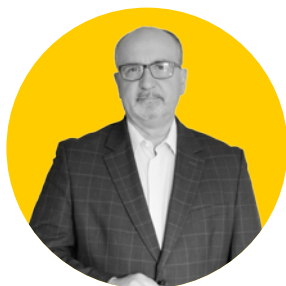
Andrzej Rogozinski WICEPREZES Powiat Wolsztyński